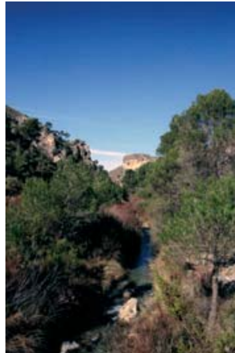
Hábitat típico de Besdolus bicolor

Estudios tendentes a conocer la distribución real de la especie y el estado de sus poblaciones, así como diferentes aspectos de la biología de las ninfas y adultos. Mantenimiento o restauración de las condiciones naturales y calidad de las aguas de los medios fluviales donde habitan.